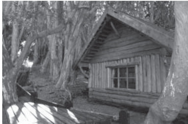
Parque Nacional Los Arrayanes

En el documento final del último Congreso Mundial de Parques Nacionales, realizado en el 2003 en la ciudad sudafricana de Durban, se recomendó que «se conciba al turismo como un instrumento de la conservación y apoyo a las áreas naturales protegidas, puesto que constituye la principal fuente de ingresos para financiar actividades de conservación».